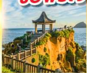
เกาะเหอผิง

พักย่านซีเหมินติง 2 คืน ขอพรเจ้าแม่กวนอิมพันมือ