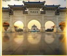
อนุสรณ์เจียงโคเซค