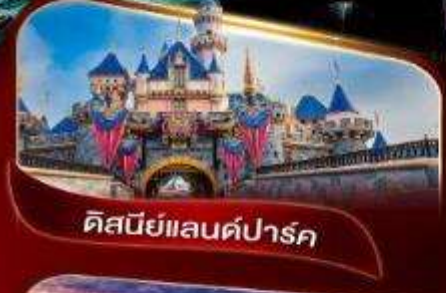
ดิสนีย์แลนด์พาร์ค