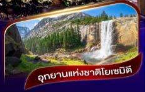
อุทยานแห่งชาติโยเซมิตี