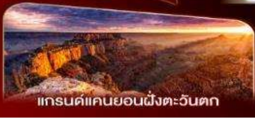
แกรนด์แคนยอนฝั่งตะวันตก

พักลาสเวกัส 2 คืน เต็มอิ่มกับแสงสีแห่งอเมริกา