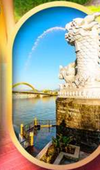
คาร์พดราทอน