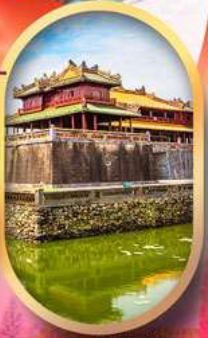
พระราชวังไคโน้ย