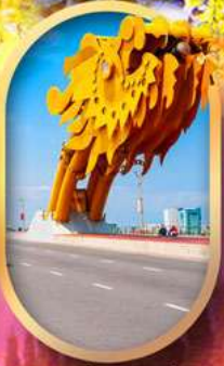
สะพานมังกรคานัง