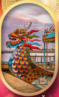
ล่องเรือมังกรแม่น้ำหอม