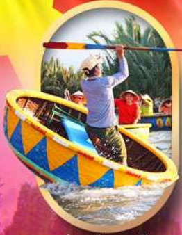
ล่องเรือกระดังง์