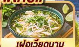
เฟอเวียดนาม