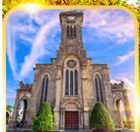
โบสถ์หินญาจาง