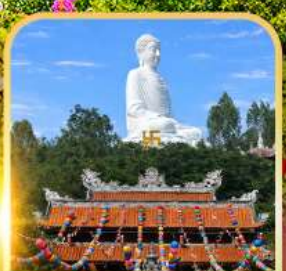
วัดลองเซิน