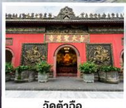
วัดตำฉือ