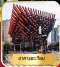
อาคารตะเกียบ