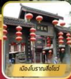
เมืองโบราณสี่ฮั่ว