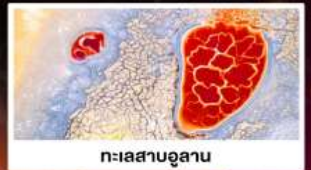
ทะเลสาบอูแลกัน