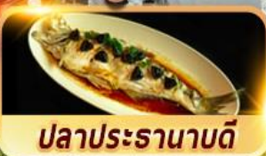
ปลาประสานบดี