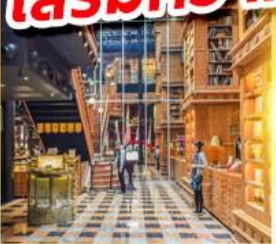
ร้านไอศกรีมมียาฮารา