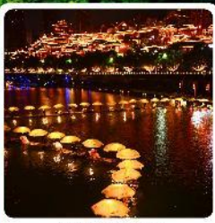
เมืองเซียนเอิน