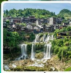
ฟู่หลงจีน

• โฮลท์ อุกยานเทียนเหมินซาน หุบเขาอวตาร เมืองโบราณเซียนเอิน หมู่บ้านโบราณฟู่หลงจีน ภูเขาโรซ่าอู๋จียโต อุกยานชื่อจื่อกวนด่านสิงโต