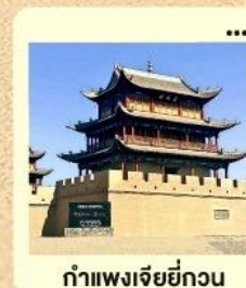
กำแพงเจียยี่กวน