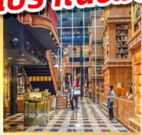
ร้านไอศกรีมมิยาฮาระ