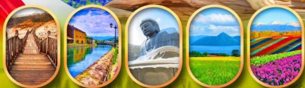
หุบเขาจิกุกดาบิ คลองโอตารุ เนินเขาแห่งพระพุทธรเจ้า ทะเลสาบโทยะ สวนดอกไม้ชิชิโซ

เที่ยวเต็ม ไม่มีฟรีเคย์ แวะพักเครื่องบิน 1 ชม.