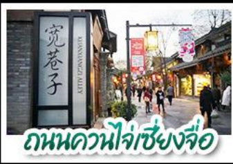
ถนนควนโจ้วเซียงจื่อ