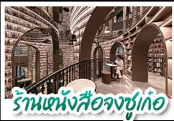
ร้านหนังสือจงซูเก๋

อุทยานสี่ดรุณี - อุทยานป่ิงโกว - วัดต้าฉือ หมีแพนด้าอนุเชลฟี - ร้านหนังสือจงซูเก๋ ถนนโบราณชอยกว้างชอยเคบ ช้อปปิ้งถนนไท่กู่หลี่ + ถนนชุนซู่ CHENGDU TIMES OUTLETS