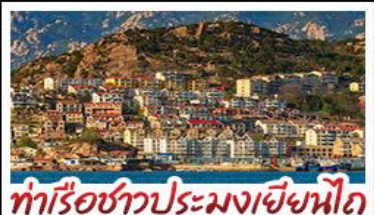
ทำเรือชาวประมงเยียนโก