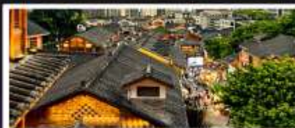
เมืองโบราณสือปาตี