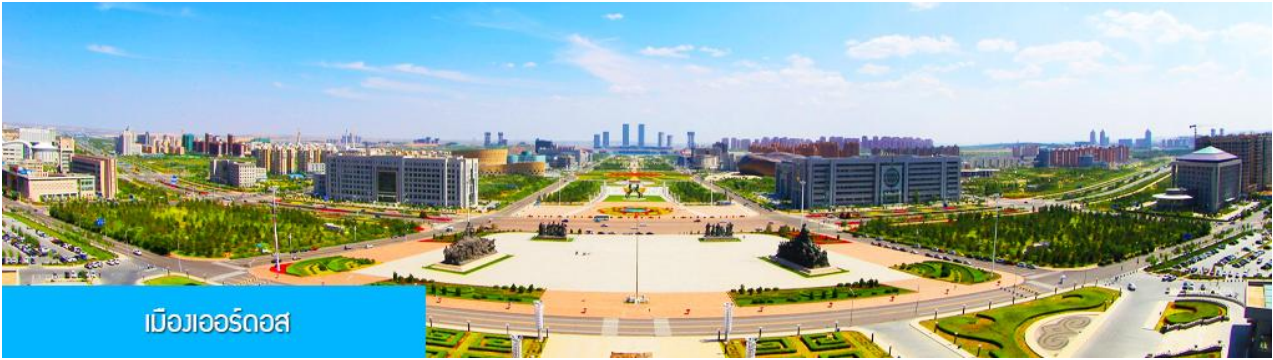
เมืองออร์ดอส