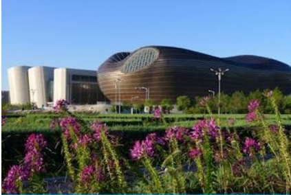
อุทยานคังปาสือ