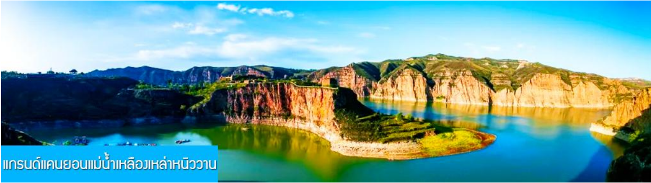
แกรนด์แคนยอนแม่น้ำเหลืองเหล่าหนิววาน

พักที่ DALATEQI SHNAGJING HOTEL โรงแรมระดับ 4 ดาวหรือเทียบเท่าในเมืองต้าลาเท่อ