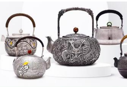
พิพิธภัณฑ์เครื่องปั้นของโกล