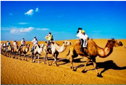
เนินทรายเสียงซาวาน

เที่ยง รับประทานอาหารกลางวัน ณ ภัตตาคาร (5)