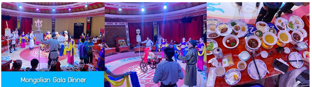
Mongolian Gala Dinner

那达慕 Naadam Festival หรือเทศกาลเฉลิมฉลองที่คล้ายวันตรุษจีนของชาวจีน ประกอบด้วยกิจกรรมการละเล่นพื้นเมืองแบบมองโกล รวม 22 อย่าง ได้แก่ พิธีแต่งงานเออร์คอส / การขี่ม้าในสนาม / ปาร์ตี้รอบกองไฟ / ขี่ม้าถ่ายรูป / สไลเดอร์หญ้า / รถลางทุ่งหญ้า / สวนแขวงกต / สวนเด็กเล่น / ตีกอล์ฟทุ่งหญ้า / รถบังคับเปเปอร์ / รถโกคาร์ท / โยนบอลทุ่งหญ้า / ปีนไฟมองโกล / ยิงธนูไนรม์ / แข่งขันจับแกะ / คล้องม้าจำลอง / หมูเลี้ยงน้ำเอ็นดู / เครื่องเล่นหมุน / เลี้ยงแกะโยน / ยิงธนู / ทอยแจกัน / เซ็นต์ชื่อภาษา มองโกล ให้เลือกเล่นได้ 12 อย่างตามรายการที่ระบุ.....อัตราค่าบริการสำหรับ 那达慕 Naadam Festival 380 หยวน หรือ 1,900 บาท/ท่าน (สำหรับลูกค้าทัวร์ที่ไม่ซื้อโปรแกรมเสริม สามารถเดินเล่น ถ่ายรูปบริเวณทุ่งหญ้าหรือพักผ่อนตามอัธยาศัย)