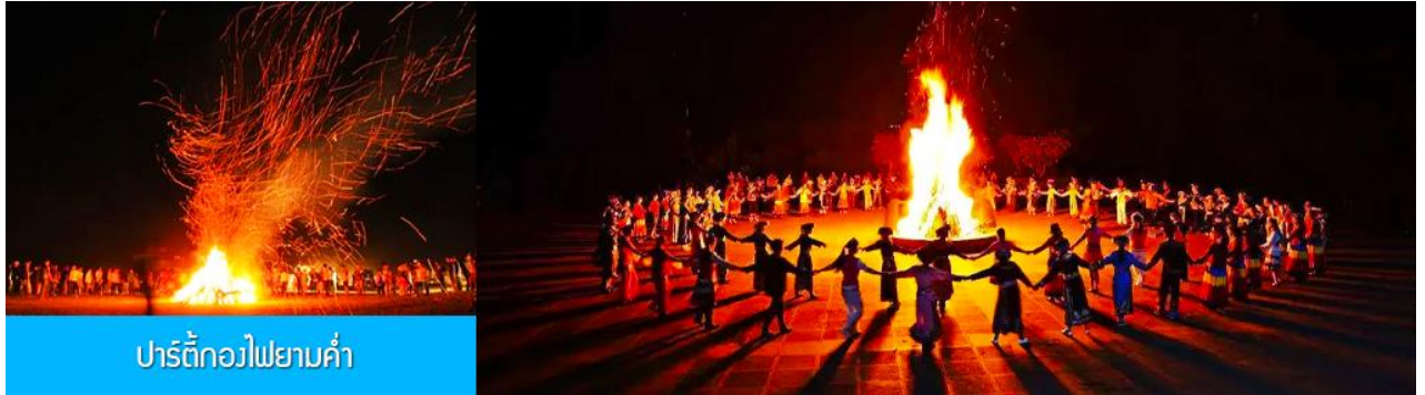
ปาร์ตี้กองไฟยามค่ำ