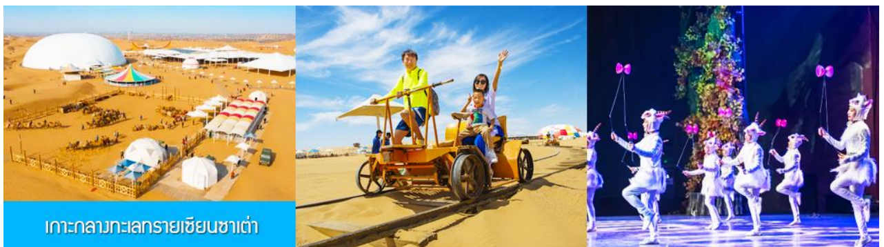
เกาะกลางทะเลทรายเขียนซาเต่า