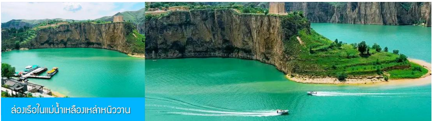
ล่องเรือในแม่น้ำเหลืองเหล่าหนิววาน

รับประทานอาหารกลางวัน ณ ร้านอาหารระหว่างทาง (8)