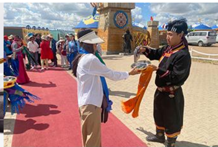
พิธีต้อนรับแขกด้วยเหล้า