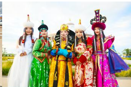
แต่งชุดพื้นเมืองมองโกล