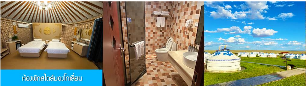
ห้องพักรีสไทม์มองโกลเลียน