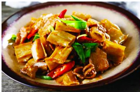
ถนนคนเดินเออร์ดอส

จากนั้นนำท่านเที่ยวชม อุทยานคังปาสือ 康巴什景区 เป็นเขตเมืองใหม่ที่ถูกเนรมิตขึ้นและได้รับการขึ้นทะเบียนเป็นอุทยานท่องเที่ยวระดับ 4A และเป็นศูนย์กลางความเจริญของเมืองเออร์ดอส ประกอบด้วยจัตุรัส ซิมปาร์ค พิพิธภัณฑ์ แกรนด์เธียร์เตอร์ ศูนย์วัฒนธรรม และสนามแข่งรถนานาชาติ นำท่านนั่งรถผ่านชมจัตุรัสรัฐบาล ทะเลสาบอุหลันมู่ สวนศิลปะงานปาติมากรรมเอเชีย ฯลฯ