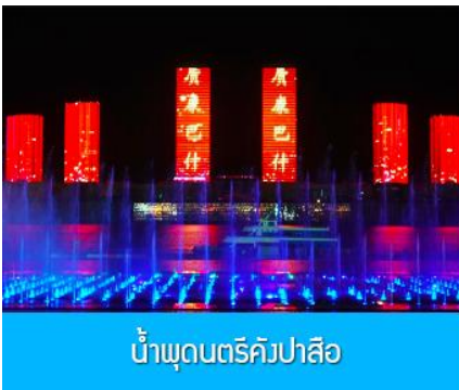
น้ำพุดนตรีคังปาสื่อ