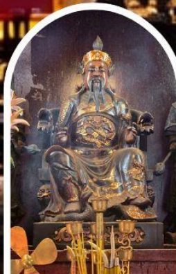
วัดปักไต

ขอเทพเจ้ากวนอู ความซื่อสัตย์ เงินทอง ธุรกิจมั่นคง