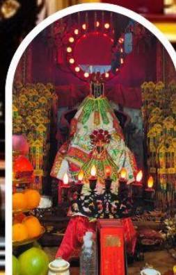
วัดเจ้าแม่กวนอิมอ่องฮำ

เสริมโชคกลางนำความรุ่งเรืองทุกด้านของชีวิต