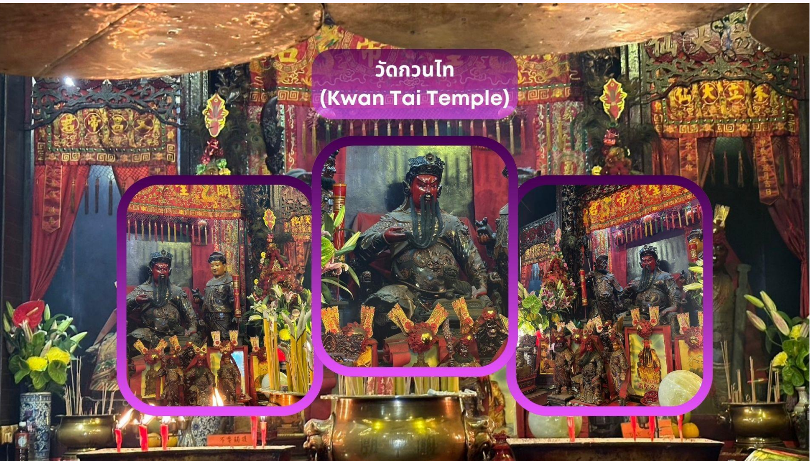
วัดกวนไท (Kwan Tai Temple)

โดยแจ้งปี ค.ศ. แก่เจ้าหน้าที่ภายในวิหาร เพื่อทำการตรวจแผนภูมิตวงชะตาและแนะนำองค์พระประจำปีเกิดที่ถูกต้อง ทั้งนี้ ในแต่ละราศีและแต่ละปีเกิด จะมีพระประจำปีรวม 5 องค์ ซึ่งล้วนมีความหมายและพลังคุ้มครองแตกต่างกันไป โดนจะมีโคงค์และเจ้าหน้าที่ประจำวิหารคอยนำการทำพิธีอย่างละเอียด ตามหลักความเชื่อดั้งเดิมของชาวท้องถิ่น เพื่อให้การสักการะถูกต้อง ครบถ้วน และเปี่ยมไปด้วยความศรัทธา