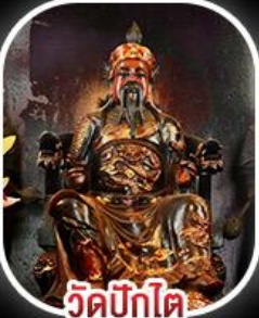
วัดบิกไค