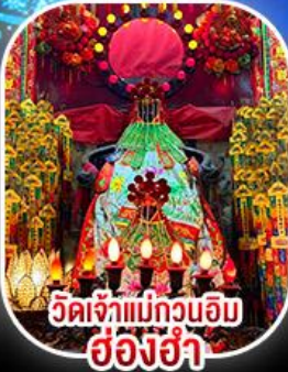
วัดเจ้าแม่กวนอิมฮ่องอ่า