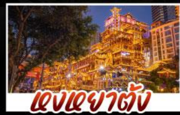
แสงเงาตัว

สัมผัสประสบการณ์เที่ยวจีนแบบเต็มอิ่ม ทั้งความล้ำสมัยของมหานครฉิ่ง และความงามตาตระการตาของธรรมชาติที่อู่หลิน ทุกการเดินทางเต็มไปด้วยความสะดวกสบายและคุ้มค่าที่สุด!