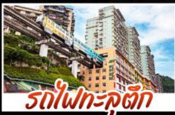
รถไฟฟ้าสุดล้ำ