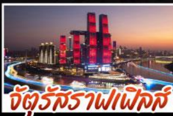
จัตุรัสราฟาเอล