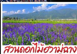
สวนดอกไม้ฮัวมู่ฉาง