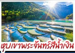
ตูปเขาพระจันทร์สีน้ำเงิน