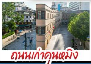
ถนนเก่าคุนหมิง

ภูเขาหิมะมังกรหยก+กระเช้าใหญ่ วัดลามะซงจันหลิน - ถนนเก่าคุณหมิง รถไฟขบวนวิวกุหาหิมะมังกรหยก หุบเขาพระจันทร์สีน้ำเงิน - ช่องแคบเสือกะโจน เมนูพิเศษ ขนมหิมะสามเสพาน สุกั๊บล่าแซมมอน อาหารกวางตุ้ง