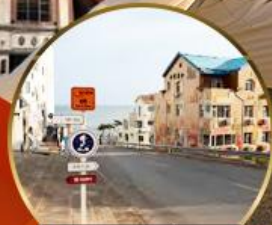
ถนนอ่าวจีป่า