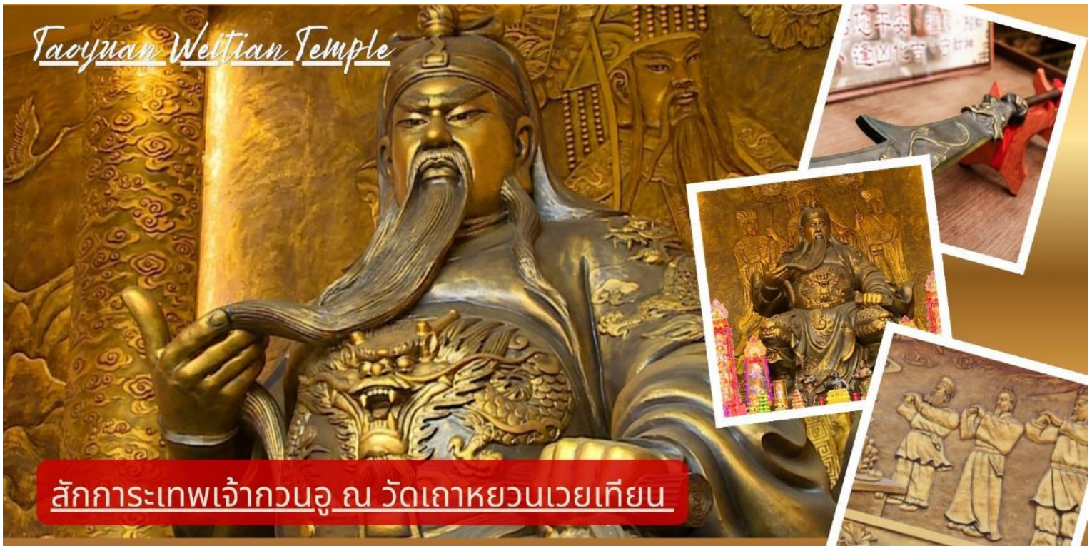
Taoyuan Weitian Temple