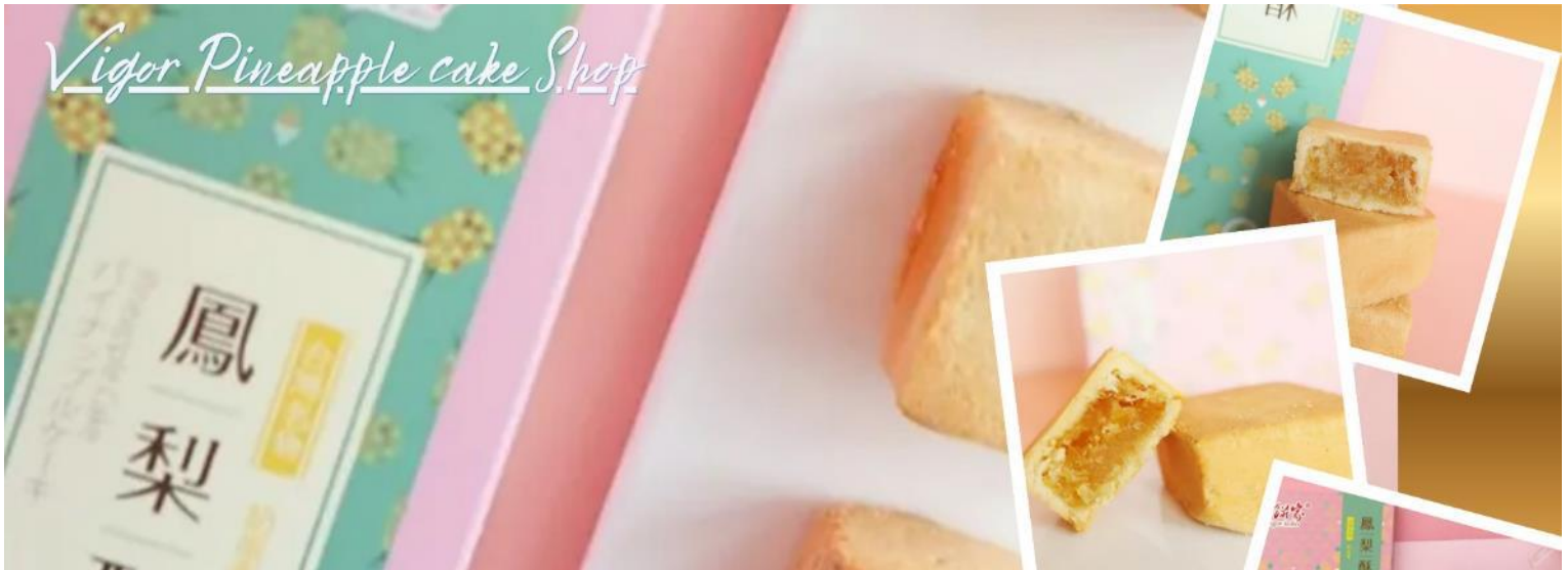
Vigor Pineapple cake Shop

จากนั้นแวะซื้อป๊องร้านพายสับปะรด (Vigor Kobo) สินค้าขึ้นชื่อของไต้หวันที่ได้รับความนิยมระดับสากล อิสระเลือกซื้อเป็นของฝากอามอัธยาศัย