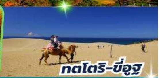
กตโตริ-ขี่อูฐ