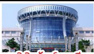
พิพิธภัณฑสถานแห่งชาติ

สวนสนุก FANTASYLAND - หมู่บ้านสไตล์ยุโรป พิพิธภัณฑสถานแห่งชาติ - ถนนคนเดินสามตรอกสองซอย ท่าเรือกิ่งจี่ - ศาลเจ้าแม่กวนอิมพันกร เมมูพิเศษ อาหารกลางวัน , สุกีชาบูหม่าล่า