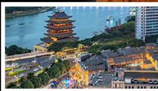
ถนนคนเดินสามตรอกสองซอย