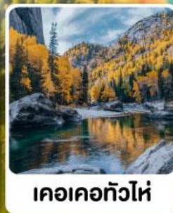
เคอเคทัวไห่