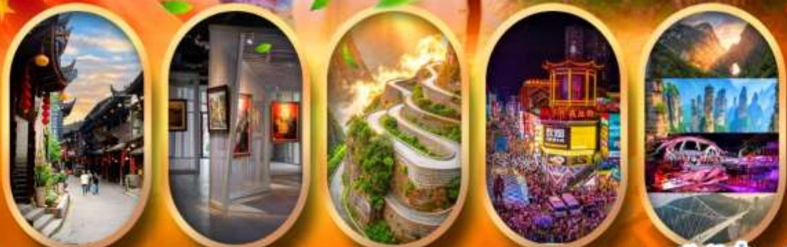
เมืองโบราณฟูหลงเจี้ยน พิพิธภัณฑ์ภาพหินทราย หุบเขาป้ายช้าง ถนนคนเดินซิงลู่ ฟรีคีย์เลือกซื้อ Option เสริม

✔ ลงร้าน ✔ ช้อปปิ้ง ✔ ฟรีคีย์ ✔ เลือกซื้อของพรีเซ็น