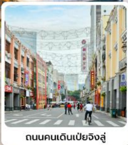
ถนนคนเดินเป่ย์จิงลู่