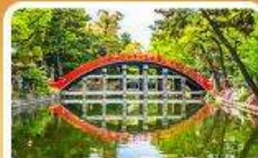
ศาลเจ้าสุมิโยชิ โทคะ