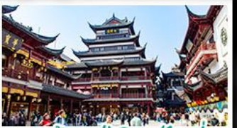
ตลาดร้อยปีเฉิงหวงเมี่ย