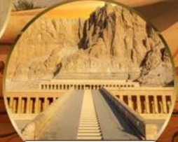
หุบเขากษัตริย์

QATAR QR831 09.05-11.50 QR1301 14.10-16.50 QR1302 18.50-23.10 QR834 02.35-13.25 เส้นทางด้วยสายการบิน Qatar Airways (QR)