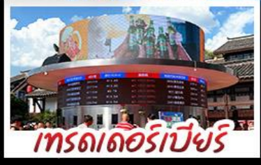
เกรตเตอร์เบียร์