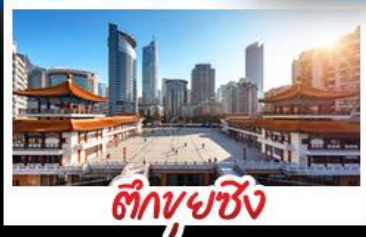
ตึกพวยซิง