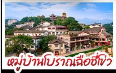
หมู่บ้านโบราณฉือซิง

พระเอกสลักหินตัวจู้ - ตึกตะเกียบ Raffles City - ตึกพวยซิง เกรตเตอร์เบียร์ - หมู่บ้านโบราณฉือซิง