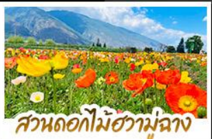
สวนดอกไม้ฮวามู่ฉาง