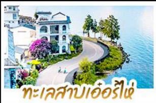
ทะเลสาบเอ๋อร์ไห่