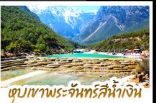
เขาสระร้อนจันทรสีน้ำเงิน