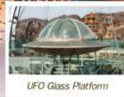
UFO Glass Platform