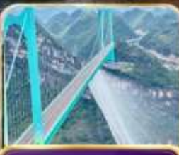
สะพานฮวาเกียง