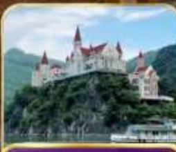
ล่องทะเลสาบวันเฟิงหู