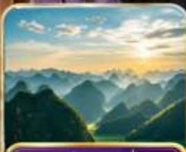
อุทยานป่าภูเขามินหยอด (รวมรถแบตเตอร์ )