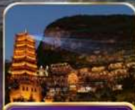
หมู่บ้านโบราณเฟิงหลินบู้อี้ (รวมรถแบต)

คุนหมิง ซิงอี้ เมืองโบราณเฟิงบู้อี้ อุทยานป่าภูเขามินหยอด 6 วัน 5 คืน