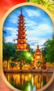
วัดอินทิมรุก