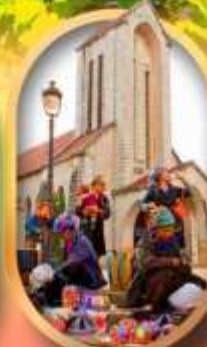
โบสถ์หินซาปา