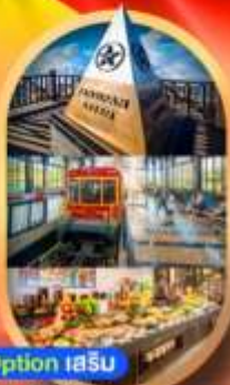
Option 1 เสริบ