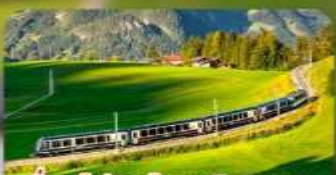
นั้งรถไฟสายโรแมนติก 3 สาย Golden Pass / Luzern Interlaken Express / Gornergrat